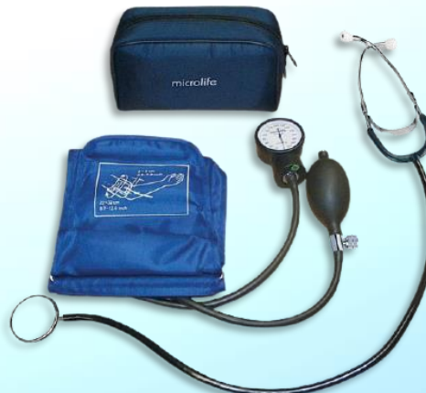
Microlife BP AG1-30 Αναλογικό Πιεσόμετρο