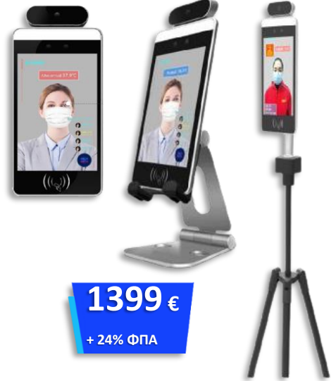
Θερμική κάμερα ανίχνευσης σωματικής θερμοκρασίας 8"