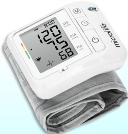
Πιεσόμετρο Καρπού Microlife BP W1 Basic