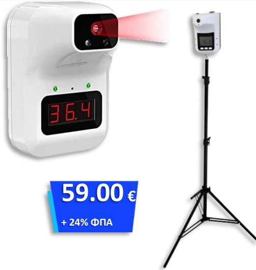
Θερμόμετρο Υπερύθρων Μετώπου με τρίποδο στήριξης