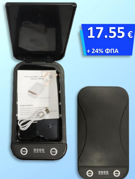
UV Sterilizer Κινητού