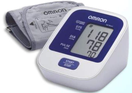
Πιεσόμετρο Ψηφιακό OMRON M2 basic