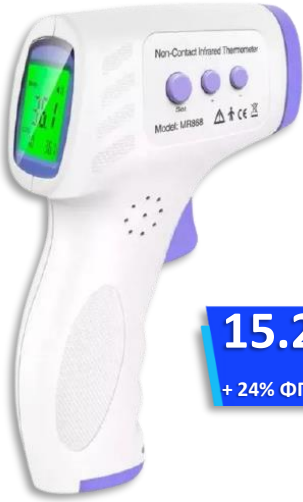
Θερμόμετρο Υπερύθρων Μετώπου