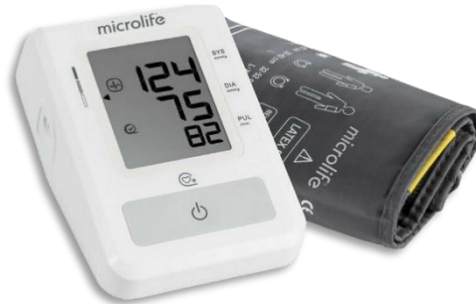
Πιεσόμετρο Ψηφιακό BP B2 basic Microlife