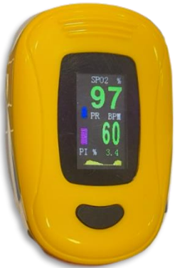
Παλμικό οξύμετρο δακτύλου